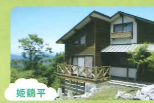
姫鶴平 別荘気分利用できる