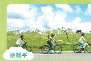
姫鶴平 爽快サイクリングへ出発