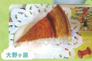
大野ヶ原 高原スイーツが味わえる

四国カルスト森林セラピーロード 星ふるヴィレッジ TENGUの駐車場東側に整備された遊歩道。気軽にハイキングが楽しめる。