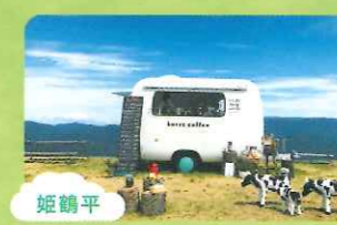
姫鶴平 フォトジェニックなカフェスタンド