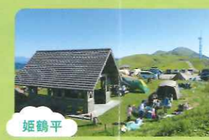
姫鶴平 天空のキャンプ場