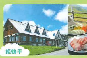
姫鶴平 姫鶴平観光の拠点