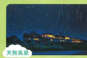
天狗高原 星をテーマにした宿泊施設